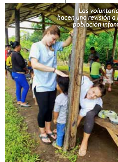
Las voluntarias hacen una revisión a la población infantil

No solo fue la dedicación al hospital, sino que pudimos aprender de su gente, cultura y del cariño que nos mostraban día a día. Me atrevo a decir que hemos recibido más de lo que hemos podido llegar a dar. Vivir en la selva ha supuesto un cambio radical de lo que considero lo normal. Y es que salirse de esa normalidad, de la que siempre nos han mostrado, ha supuesto un antes y un después en mí pues he aprendido que existen muchas normalidades fuera de la nuestra propia.