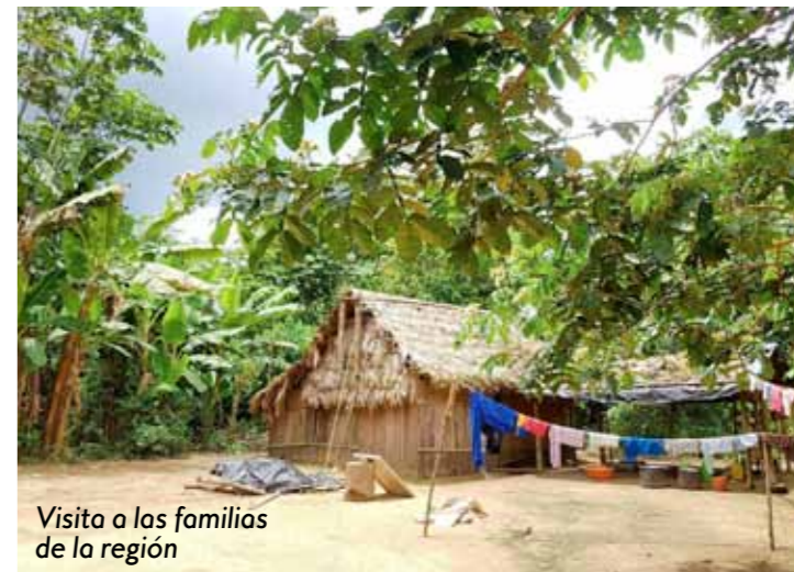
Visita a las familias de la región